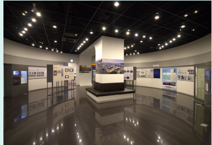
#1 나라와 기록 전시관 (제1전시관)

전시관을 둘러보며 우리나라 기록문화의 변화를 살펴보고, 체험할 수 있습니다.