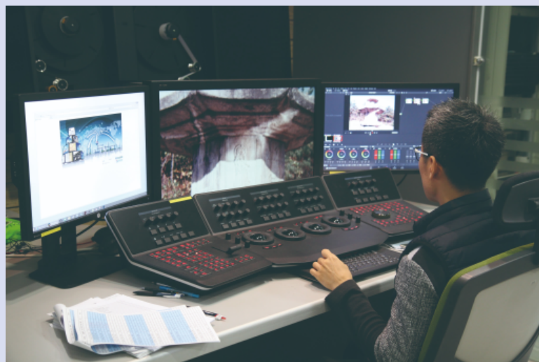
#3 시청각기록물 보존처리실