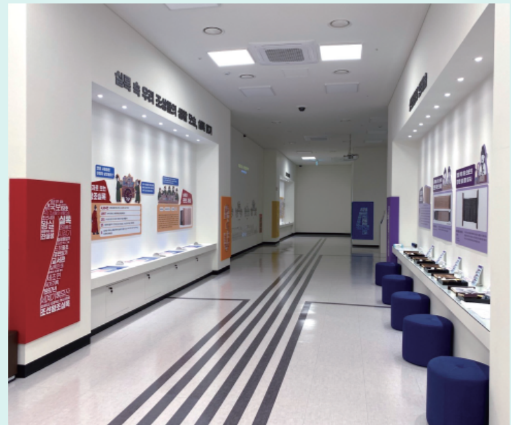
#3 기록문화 체험관 (제3전시관)