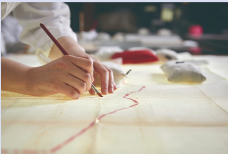
#2 기록물 복원실