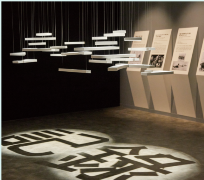
#2 세계기록유산 전시관 (제2전시관)