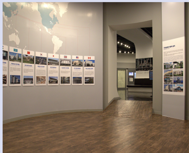
#1 국가기록원 전시관

보존·복원 등 기록물 관리가 이루어지는 주요 작업환경을 살펴볼 수 있습니다.