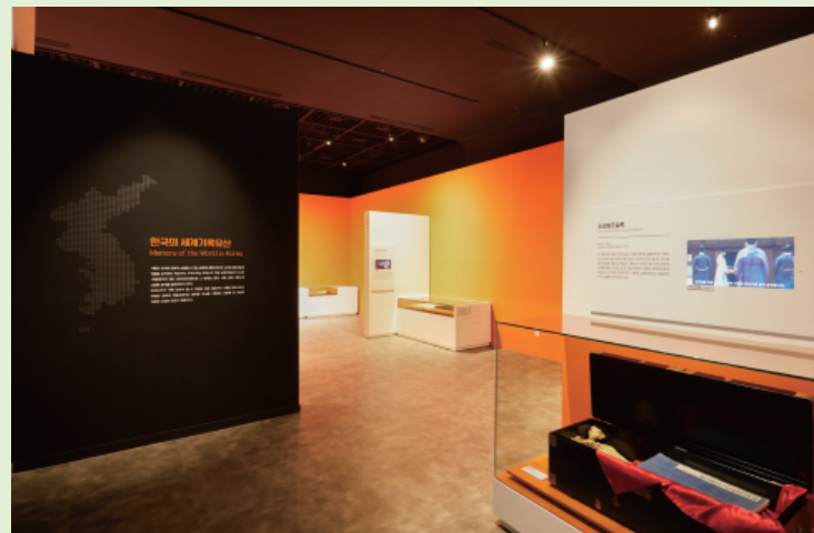
#1 국가기록원 전시관

기록물 관리 작업 환경 전반을 살펴보고, 전문적인 영역에 대해 알아볼 수 있습니다.