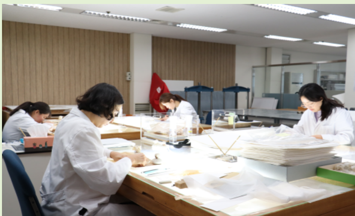
#2 기록물 복원실