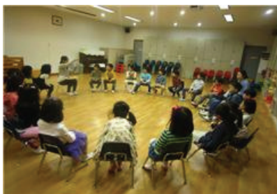
이화여대 유아교육과 교육실습생 실습 모습

4월 9일(월)부터 5월 4일(금)까지 4주간 이화여대 유아교육과 4학년 학생 14명이 교육실습을 했다. 교육실습생은 2학급에 3명, 4학급에 2명이 각각 배치되어 예비교사로서 수업참관, 부분수업, 2인 1일 수업, 1인 1일 수업 등 다양한 참여수준과 방식으로 실습을 진행하였다.