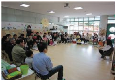
영상물을 감상하는 가족들