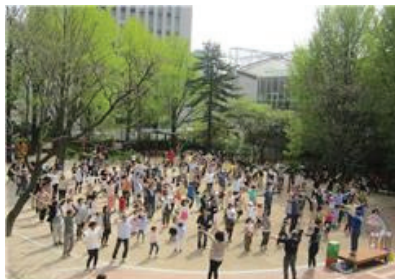
율동을 하는 가족들