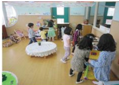
부활절 달걀 찾기 게임을 하고 있는 유아들